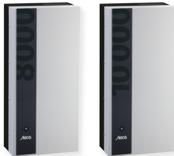
StecaGrid 8000 3ph

Die Kombination des StecaGrid 8000 3ph mit dem StecaGrid 10 000 3ph ermöglicht eine optimale Auslegung für fast alle Leistungsklassen. Es ergeben sich vielfältige Kombinationsmöglichkeiten, die ein Ziel gemeinsam haben: die effektive Nutzung der Sonneneinstrahlung.