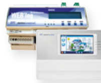
Meteocontrol WEB'log und Meteocontrol WEB'log Comfort Datenlogger