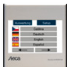
StecaGrid Monitor Datenlogger