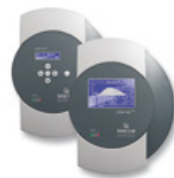
Solar-Log 500/1000™ Datenlogger